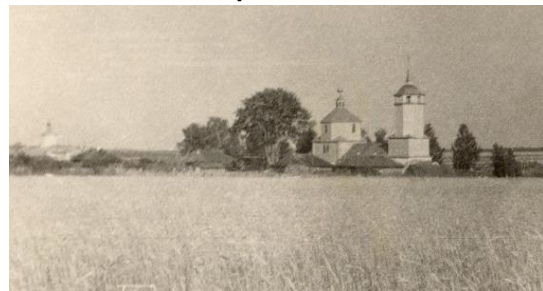
Село Анемнясево, где родилась и жила святая Матрона

От сестры блаженная Матрона перешла на житьельство к племяннику Матвею Сергеевичу, человеку доброму и религиозному. Но здесь огорчения ждали с другой стороны. У Матвея подросли дети, односельчане стали смеяться над ними, дразнить их. Эти насмешки тяжело переживались молодыми людьми. Но особенно тяжело это было для самой Матрёши. Она мучилась и глубоко скорбела, что за нее эти ни в чем не повинные люди должны были переносить иногда очень тяжелые для них оскорбления. Особенно насмешки эти усилились в революционные годы.